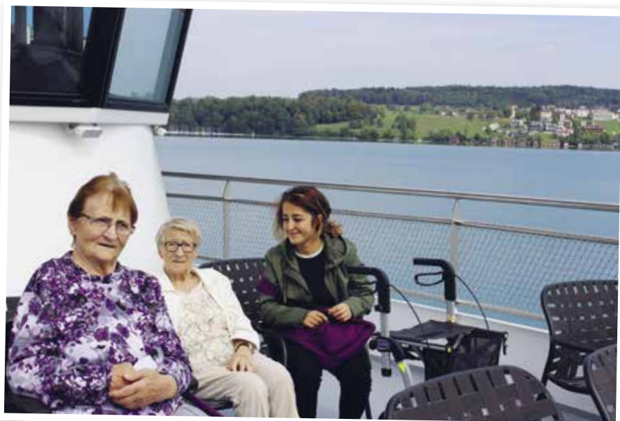
Projekt Zäme unterwäx: Schifffahrt auf dem Hallwilersee