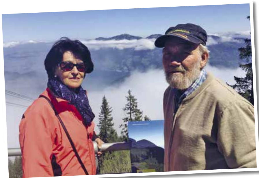
Projekt Zäme unterwäx: Ausflug auf die Klewenalp