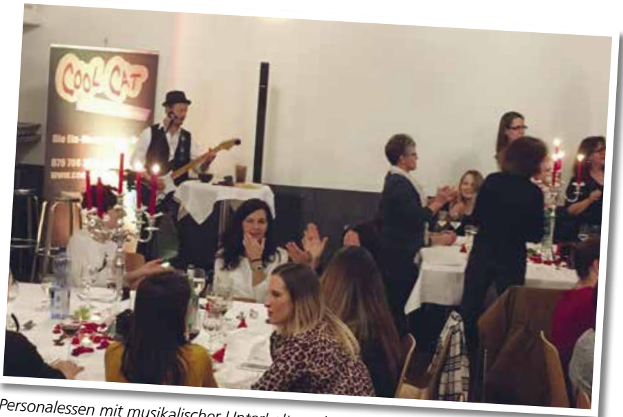
Personalesen mit musikalischer Unterhaltung im Restaurant Löwen, Boswil