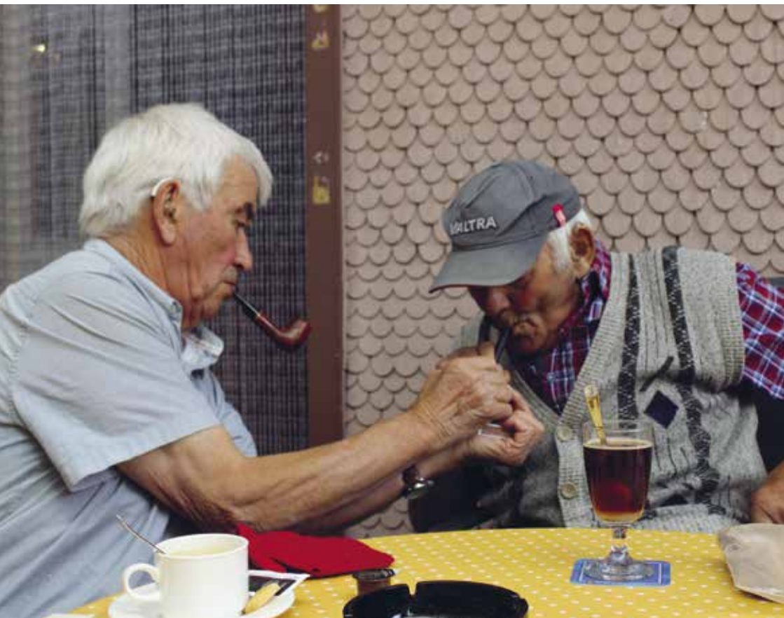
Projekt Zäme unterwäx: Ausflug nach Sumiswald

Einladung zur 49. Mitgliederversammlung 2019