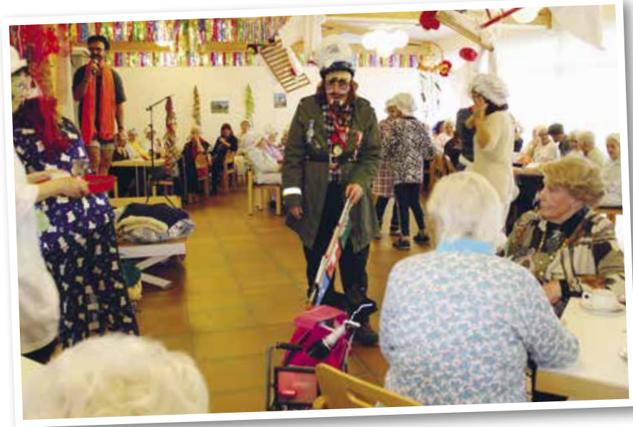
Fasnachtsball, Motto: Pyjama-Party