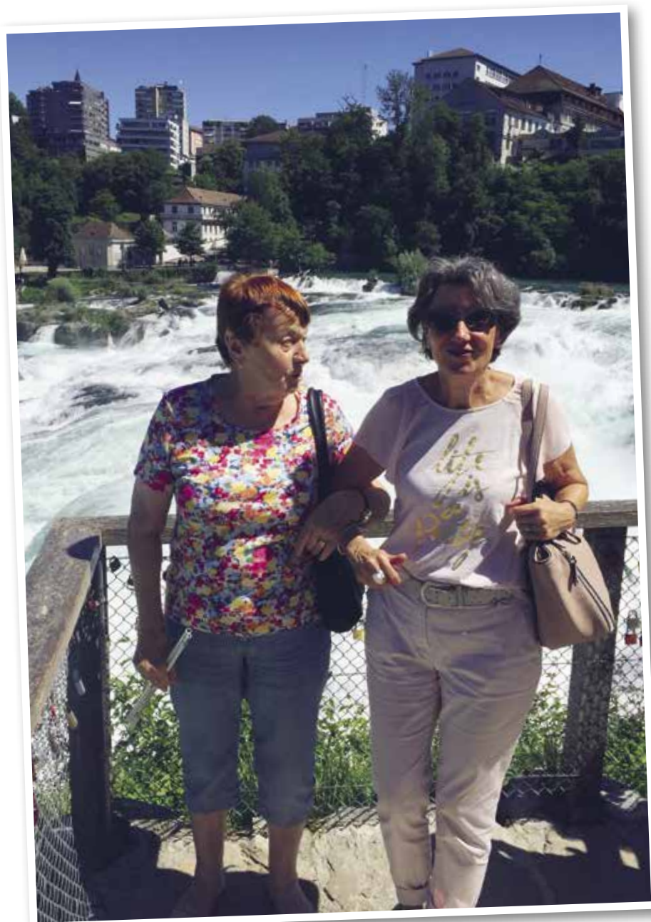
Projekt Zäme unterwäx: Ausflug an den Rheinfall